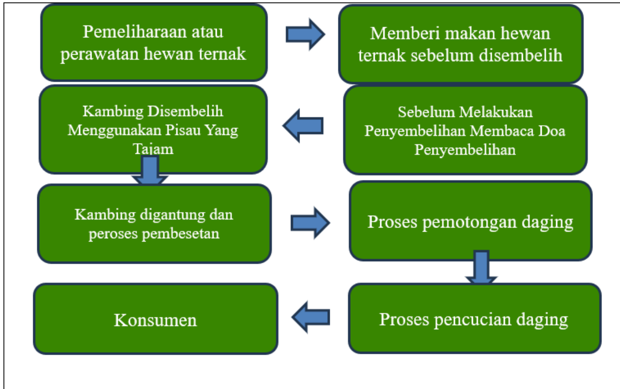
Tabel 1: Diagram Alir Produksi

Pada saat melakukan penelitian di Rumah Potong Hewan Peneliti menggambarkan Diagram Alir produksi Sebagai Berikut: